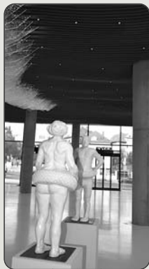
Ty už máš přezuto?